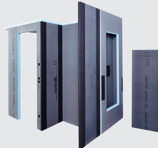
Composants de salle de bains vue latérale