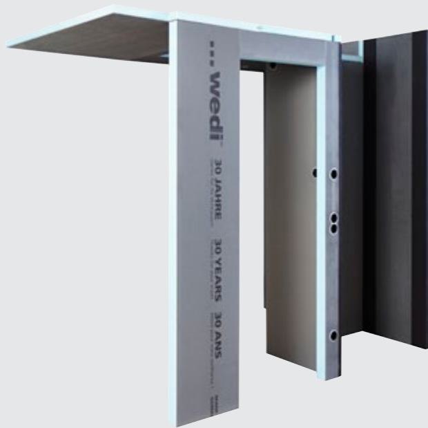
Composants de salle de bains, vue frontale