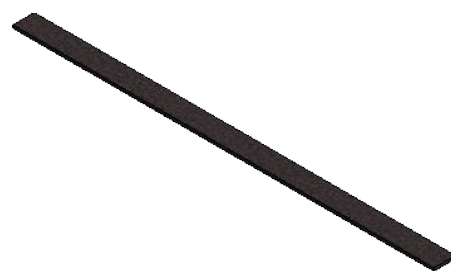
( 1 : 10 )

Diese Zeichnung / Skizze ist Eigentum der wedi GmbH und unterliegt dem Urheberrecht. Die Verwendung bedarf in jedem Fall der vorherigen, schriftlichen Zustimmung der wedi GmbH.