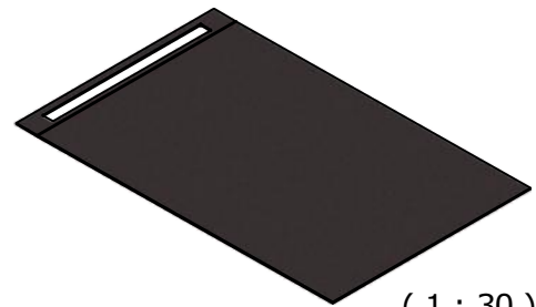
( 1 : 30 )

Diese Zeichnung / Skizze ist Eigentum der wedi GmbH und unterliegt dem Urheberrecht. Die Verwendung bedarf in jedem Fall der vorherigen, schriftlichen Zustimmung der wedi GmbH.